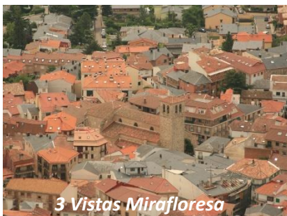
3 Vistas Miraflores

Desde el Pico de la Pala continuamos por el cordal dirección norte, en ligero ascenso, hasta alcanzar la cota de 1.886 m del Pico Perdiguera. Desde allí divisamos una magnífica vista del Huevo del Gargantón o del Cancho a nuestros pies con la Najarra y el Puerto de la Morcuera de fondo, en dirección suroeste, y del Valle de Bustarviejo con Cabeza Arcón como telón de fondo, en dirección este. El descenso se hace regresando de nuevo al Pico de la Pala y desde allí al punto de partida por el mismo camino por el que hemos ascendido.