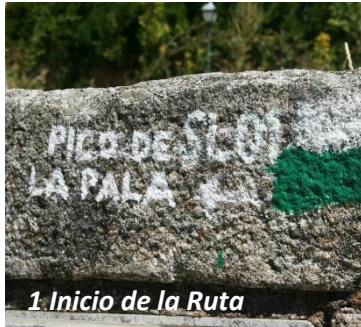
1 Inicio de la Ruta

Comenzamos nuestra ruta en la Fuente del Pino, sita en la calle del mismo nombre, para continuar por esta calle ascendiendo ligeramente hasta llegar a la segunda calle a la derecha, Travesía del Cabezuelo, que tomaremos para comenzar una pronunciada subida.