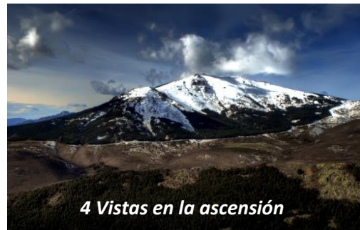
4 Vistas en la ascensión